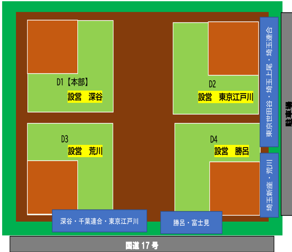
グラウンド見取り図

チーム待機場所（【蜜】にならないよう、スペースを十分確保してください。また空いているスペースを有効に活用してください）