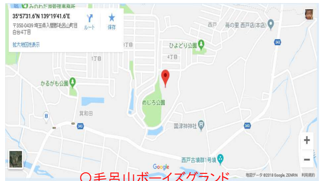
○毛呂山ボーイズグラウンド