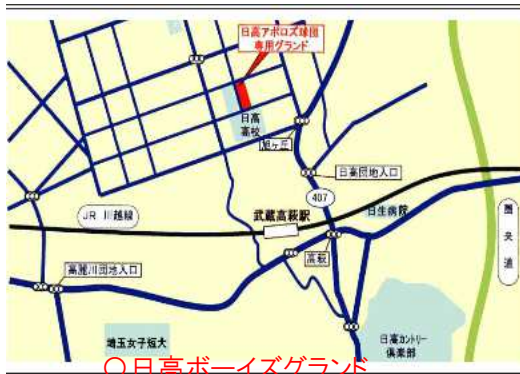
○日高ボーイズグラウンド