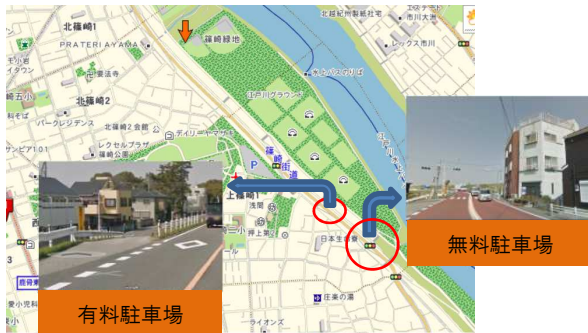
○東京江戸川ボーイズグラウンド