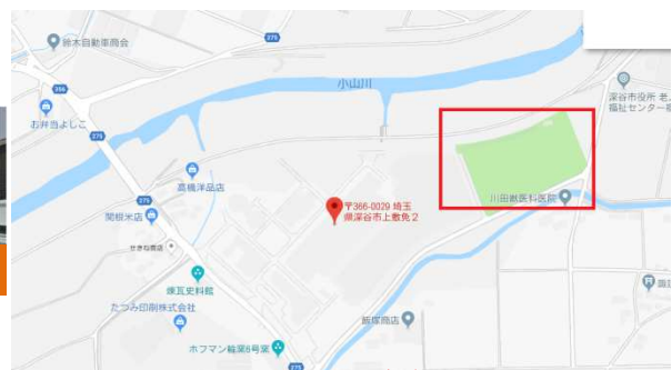
○深谷ボーイズグラウンド